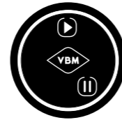
2 buttons keypad Pulsantiera a 2 pulsanti